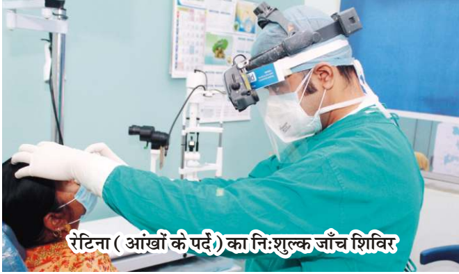
रेटिना ( आँखों के पर्दे) का निःशुल्क जाँच शिविर

दिनांक 3 दिसम्बर, 2020 को तारा नेत्रालय उदयपुर में रेटिना (आँखों के पर्दे) का निःशुल्क जाँच शिविर रखा गया जिसमें अनेक जरूरतमंद लोगों को अनुभवी विशेषज्ञ द्वारा निःशुल्क जाँच कर परामर्श दिया गया। अगला निःशुल्क जाँच शिविर जनवरी प्रथम सप्ताह में 2021 को रखा गया है। कोई भी सज्जन जो आँखों के पर्दे की समस्याओं से पीड़ित है वह निम्न नंबर पर संपर्क कर सकते हैं : 95493 99993, 96493 99993