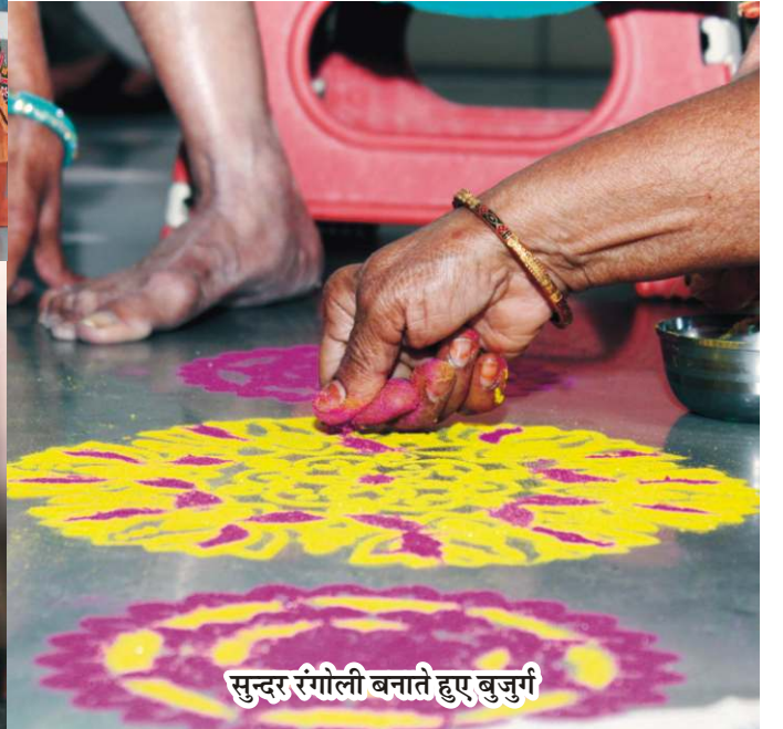
सुन्दर रंगोली बनाते हुए बुजुर्ग