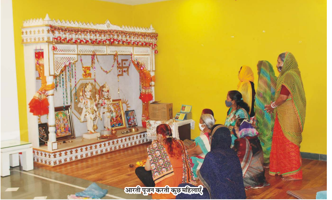
आरती पूजन करती कुछ महिलाएँ

हर वर्ष की भांति तारा संस्थान के आनन्द वृद्धाश्रमों में समस्त वासियों ने दीपावली का पर्व हर्षोल्लास के साथ मनाया। हालांकि कोरोना प्रकोप के कारण जोश की थोड़ी कमी नजर आई फिर भी आवश्यक सावधानियाँ रखते हुए समस्त बुजुर्गों ने किसी प्रकार की कमी नहीं रखी। देखिए बीते माह दीपावली उत्सव के कुछ चित्र।