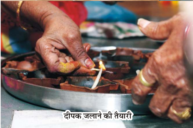
दीपक जलाने की तैयारी